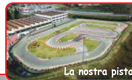
La nostra pista