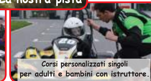
Corsi personalizzati singoli per adulti e bambini con istruttore.