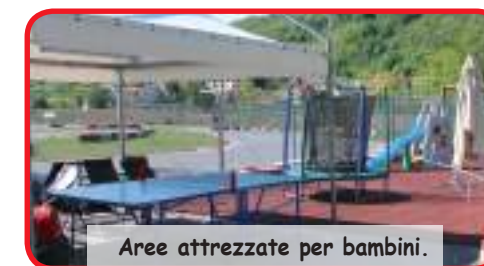
Aree attrezzate per bambini.