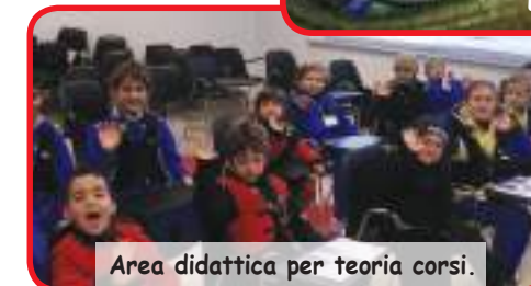
Area didattica per teoria corsi.